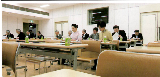
平成28年度通常総会