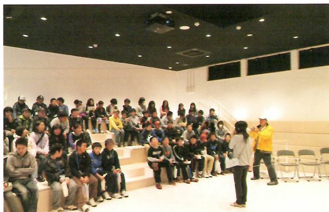
子ども探検隊（平成27年度）