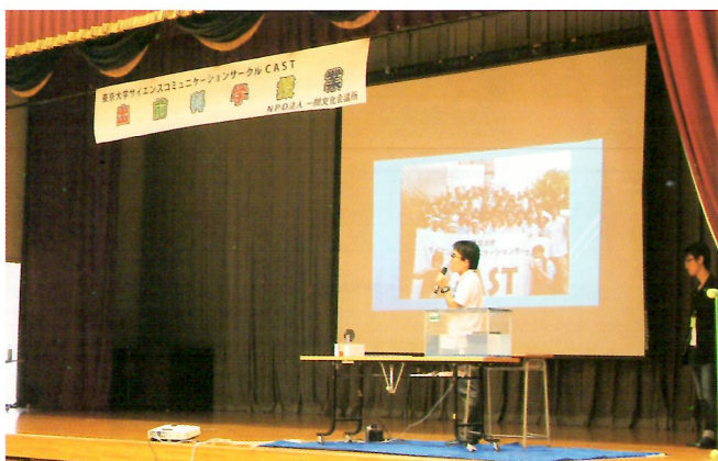
出前科学授業（平成27年度）

多様な体験の場を通して一関の子どもたちが、学ぶ喜びはもとより一関地方の魅力・ふるさとの素晴らしさを感じ、ふるさに誇りを持ってほしいと思います。