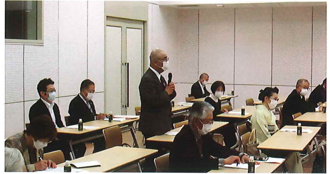
令和4年度通常総会