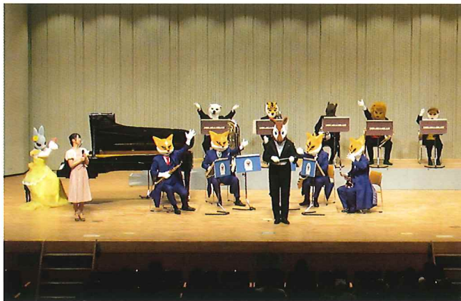
親と子のコンサート（令和3年度）

子どもたちが優れた芸術に触れて感動し、自分たちの故郷を現地を巡ることで誇りを持ち、新たな学びに興味と喜びを感じ、健やかに成長できるお手伝いの機会となれば望外の喜びです。