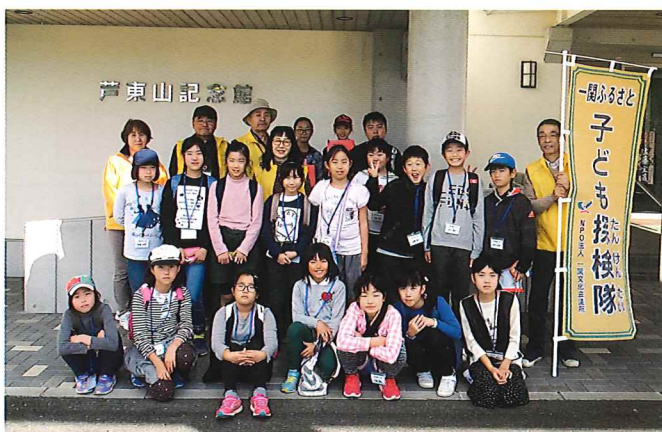
子ども探検隊参加の皆さん（平成30年度）