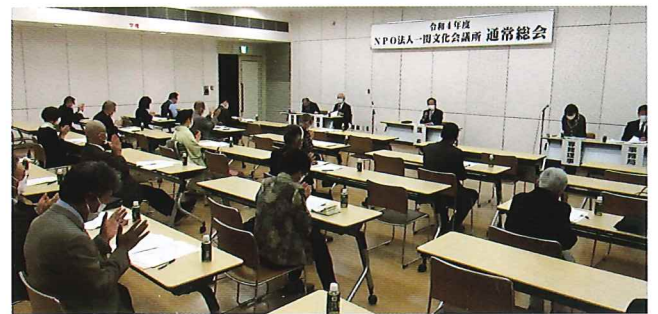
令和4年度通常総会

結びに、令和4年度も、私共は市民の皆様へ寄り添い、様々な形で文化や芸術そして当地域の歴史に触れて戴き、心が潤されて豊かな思いに浸ることができる場や事業を提供するための努力に傾注する所存です。どうか今年度も、皆様の温かい御理解と御支援を宜しくお願い申し上げます。