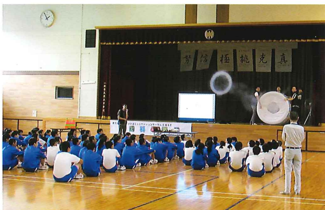
東大生出前科学授業（令和元年度）