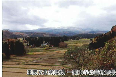
重要文化的景観 一関本寺の農村風景

第1回目は平泉の中尊寺と骨寺村荘園遺跡を巡り中世の絵図に描かれた世界を体感し、第2回目には中尊寺と骨寺村の関係性を最新の研究をもとに学びます。第3回目に奥州藤原氏の時代に作られた仏像について理解を深め、第4回目にはその時代の仏像を平泉周縁の地に訪ねて地元で守り伝えられた歴史文化を学びます。